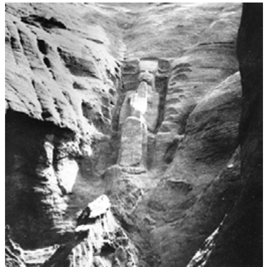
Étienne-Martin La vierge au sable 1943.

Während seines Aufenthalts in Dieulefit lernt er auch Roché, Autor von Jules et Jim kennen, mit dem er lange befreundet sein wird.